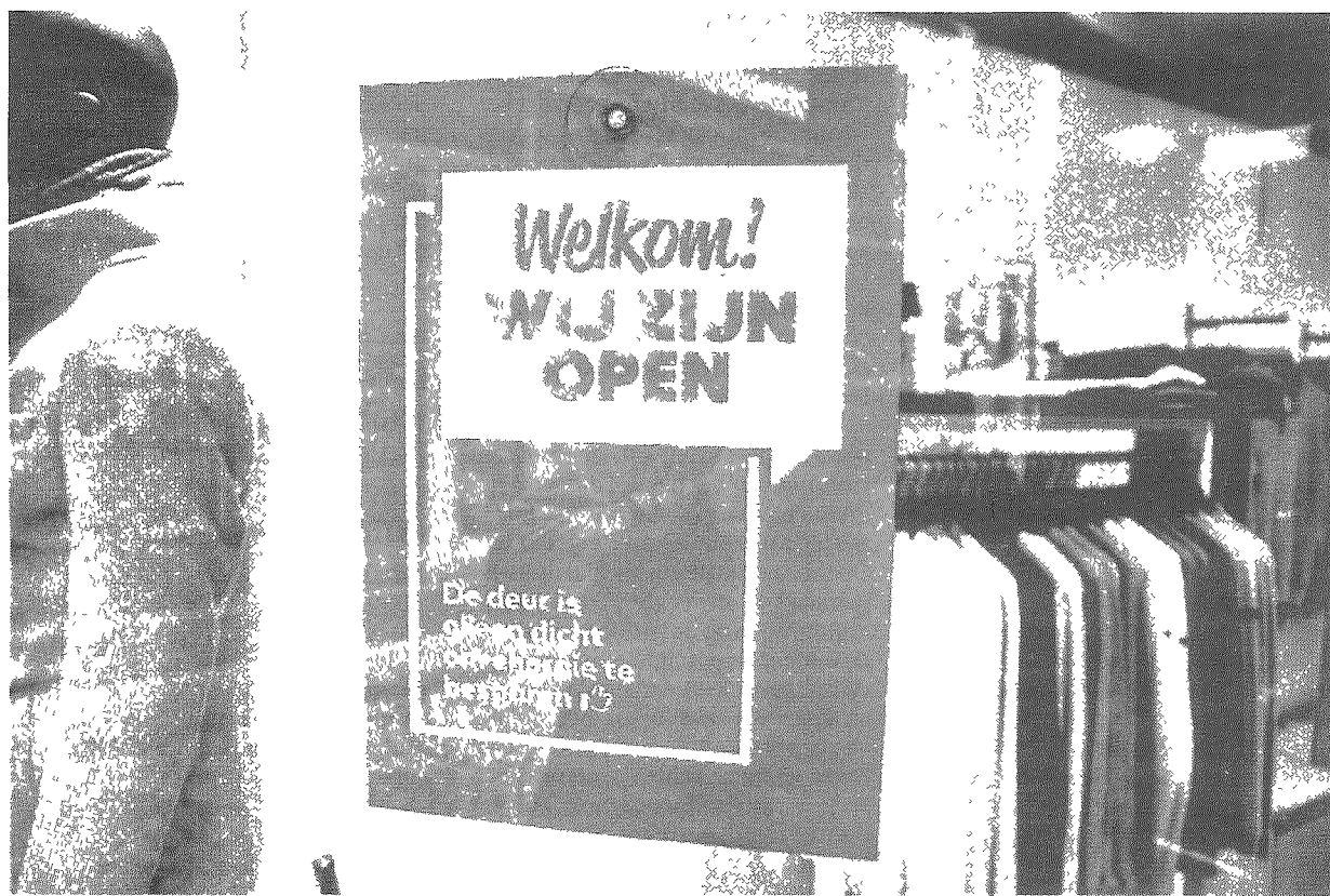
Winkelborden in Maastricht wijzen erop dat de deuren gesloten zijn om energie(kosten) te besparen.

Het kabinet heeft beloofd vrijdag te komen met de uitwerking van een energieprijzplafond. Een mooi gebaar, maar het dreigt onnodig duur en ongunstig voor het milieu uit te pakken. En het kan makkelijk veel beter.